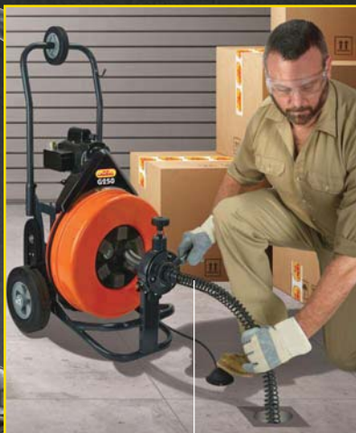
60cm lange Wellenführungs- feder