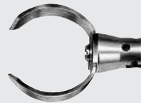
Hochleistungs-Gabelschneidkopf 75mm Bestell-Nr. 55703