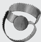
Rotations-Sägemesser 100mm Bestell-Nr. 55708